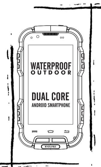
EVOLVEO StrongPhone D2